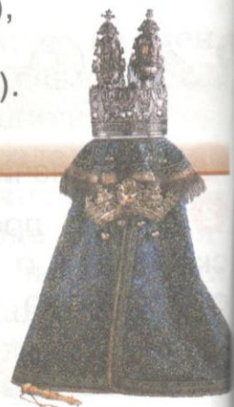
Свиток Торы в чехле с короной и указкой