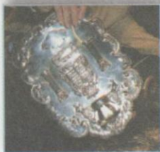
Щит для свитка Торы

Вот названия книг Торы: Берешит (Бытие), Шмот (Исход), Ваикра (Левит), Бемидбар (Числа), Дварим (Второзаконие). Тора — главная книга иудаизма.